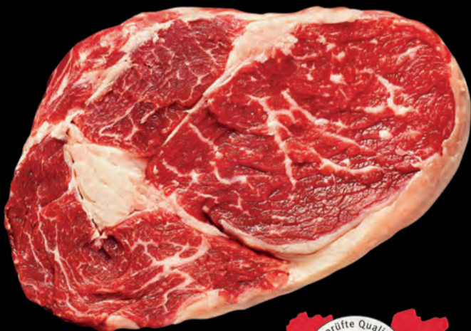
1 RIB-EYE STEAK

4 NUSS 5 TAFELSTÜCK 11 MAGERES MEISEL 12 BRUSTKERN 13 BEINFLEISCH 14 FLANKSTEAK 15 GAB 16 HALS